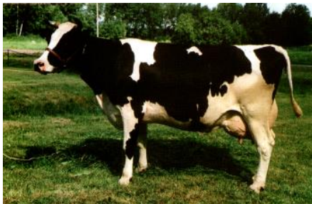
Рисунок 1 - Корова чёрно-пёстрой породы